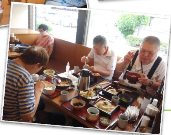
生活介護 らしく ～外食の様子～ (2023.6)